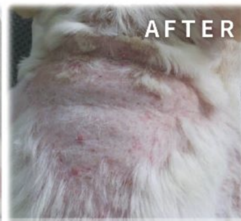
フレンチブルドッグ 10歳

何度も病院で診てもらっても、原因不明と診断され改善せず… しかし炭酸泉温浴で、たった半年でここまで改善しました！