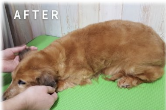
ダックスフンド 14歳

病院に2年通うも改善せず、一般のサロンで炭酸泉温浴を始め、 10日に1度の頻度で半年続けた結果、若く見られるほど綺麗な毛並に！